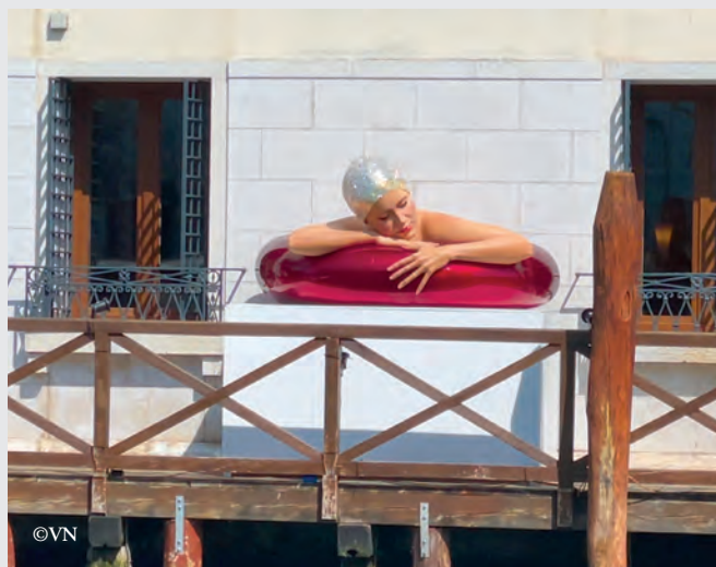
Une invitation à la détente par Carole Feuerman , qui expose de nombreuses oeuvres dans le cadre de la Biennale d'art de Venise.

- LÉGISLATIVES : Le suspense n'était pas vraiment insoutenable : Éric Ciotti , député sortant, a été réinvesti par le comité départemental des Républicains dans la 1 ère circonscription des Alpes-Maritimes (Nice) dans laquelle il