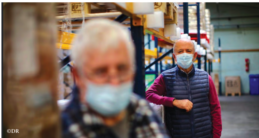
Dans les locaux des Restos du coeur.

Certains invendus non alimentaires peuvent, par exception, toujours être détruits. Aux conditions suivantes : ceux dont le recyclage est interdit car présentant un risque pour l'environnement ou la santé humaine; ceux dont le recyclage conduirait à un impact environnemental négatif, ceux pour qui il n'existe aucune solution