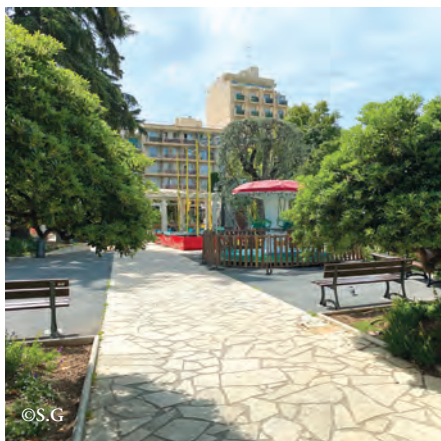
Le Square Bènes aujourd'hui.

invité à présenter son projet au cours de la séance du conseil municipal. L'agence des architectes Céline Bouzat et Christophe Erades, créée en 1999 et lauréate à plusieurs reprises du concours d'architecture contemporaine ArchiCOTE, est notamment connue pour avoir réalisé la médiathèque et salle de spectacle de Villeneuve-Loubet. Elle pilote de nombreux projets de logements en cours de construction, comme à Nice (Californie et Bon Voyage), ou en cours d'étude, par exemple à Mouans-Sartoux (Damiano Ancel) et Saint-Laurent-du-Var (Zoo).