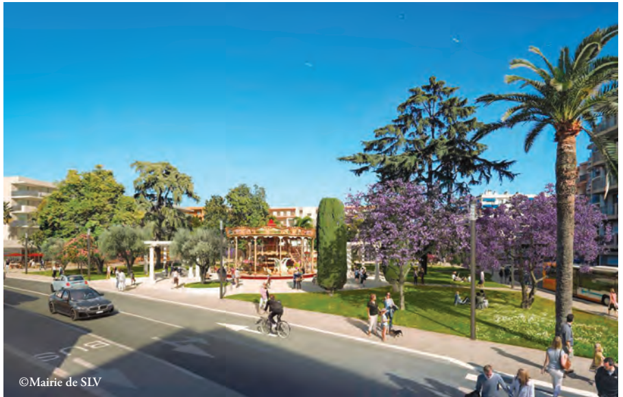
Image 3D du futur Square Bènes.